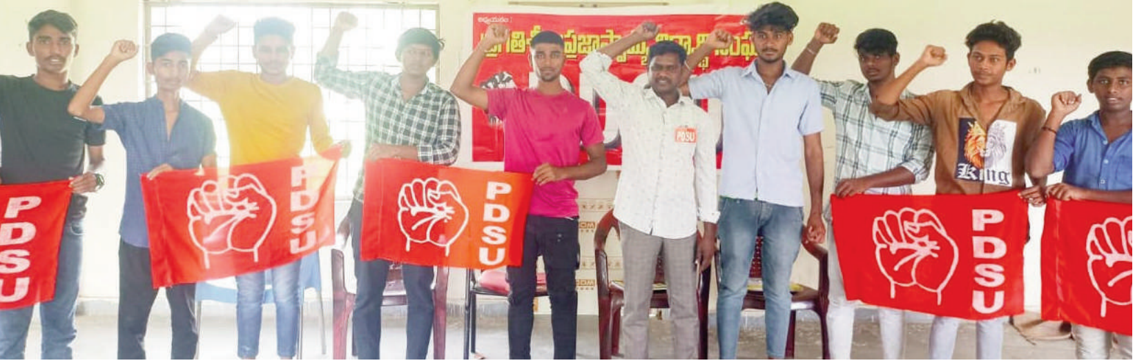
పి.డి.ఎస్.యు. రాష్ట్ర ఉపాధ్యక్షులు జనరసంహారావు