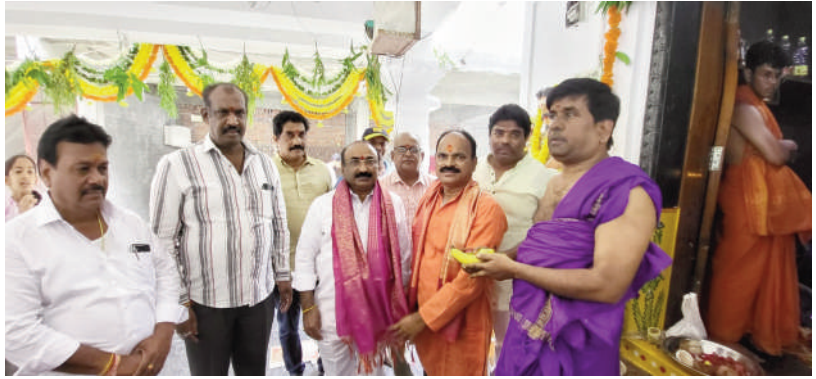
ఐమ్మెల్యే ఆఫ్ వార్త - కూకట్ పల్లి